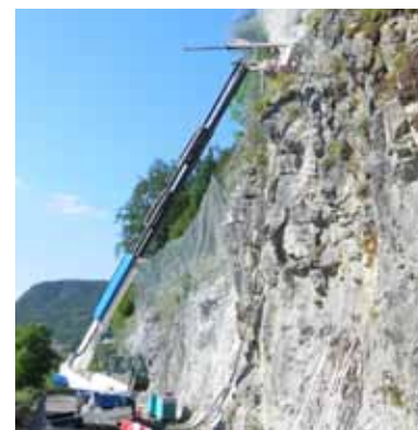
RD 295 Chancia-Montcusel (39)

Réalisation d'ancrages de confortement et de grillage sur avaloir pour la sécurisation de la falaise le long de la RD 295, commune de Chancia-Montcusel.