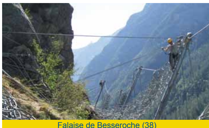
Falaise de Besseroche (38)