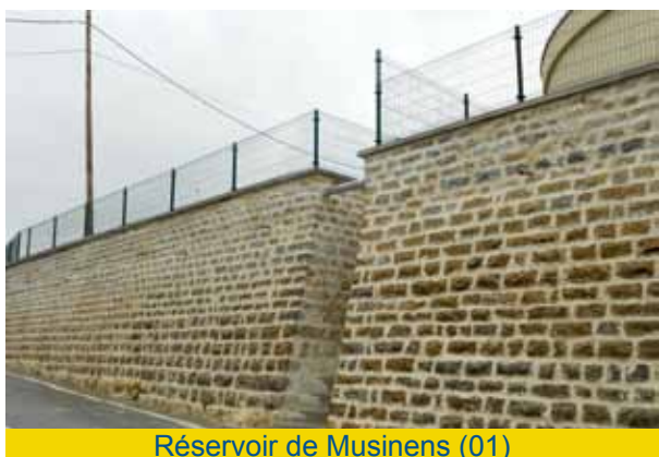
Réservoir de Musinens (01)