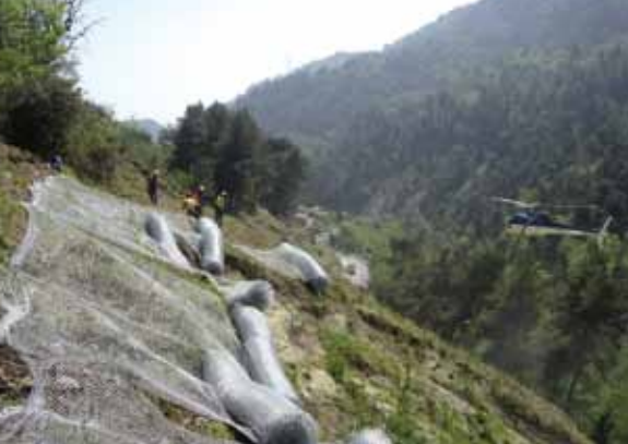
Grillage de protection