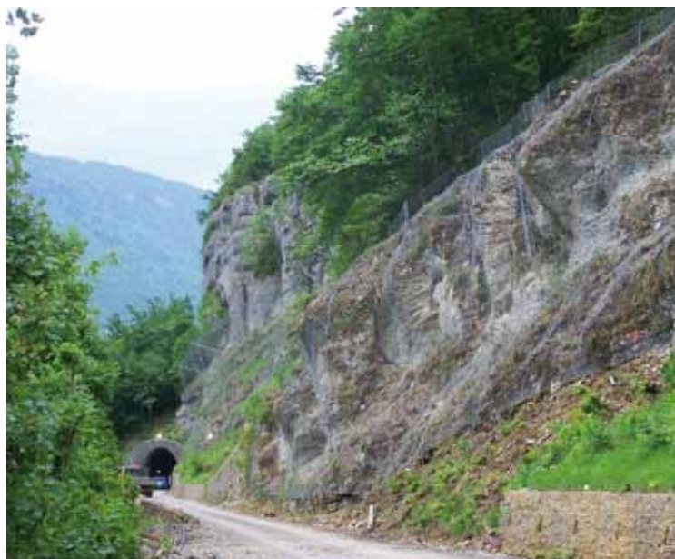
LGV Bourg-Bellegarde (01)