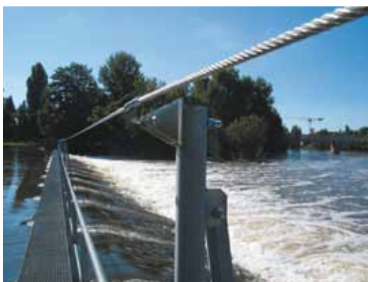
Canal du Nivernais (58)

Mise en place de ligne de vie et passerelle sur le canal du Nivernais en Bourgogne.